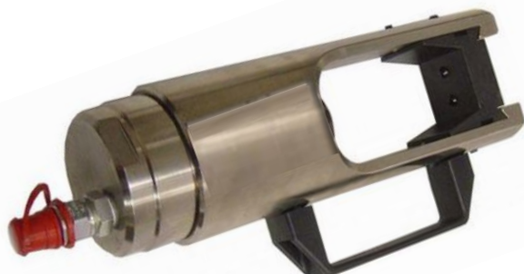
APRIETA TERMINALES HIDRÁULICOS U20 (20 Ton. esfuerzo)

Poupée fixe de compression hydraulique dotée de raccord rapide pour connecter a une pompe hydraulique