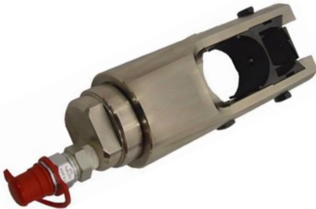
APRIETA TERMINALES HIDRÁULICOS U12 (12 Ton. esfuerzo)

Pump with 3 m. hose, to work with U12 or U20.