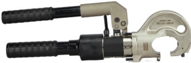
PRENSA HIDRÁULICA PHC (12 Ton. esfuerzo) PHC Hydraulic tool (Crimping force: 12 Ton.) Outil hydraulique PHC (Force de sertissage: 12 Ton.)