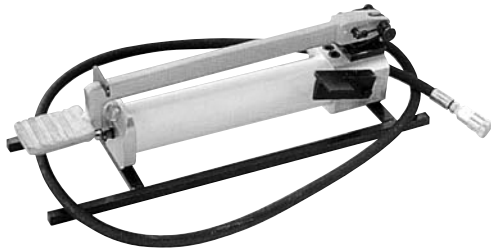
PRENSA HIDRÁULICA PHP PHP Hydraulic tool Outil hydraulique PHP

Con matrices para punzonado o apriete hexagonal de Cobre y Aluminio. Bomba a trabajar con U12 ó U20, manguera de 3 m.